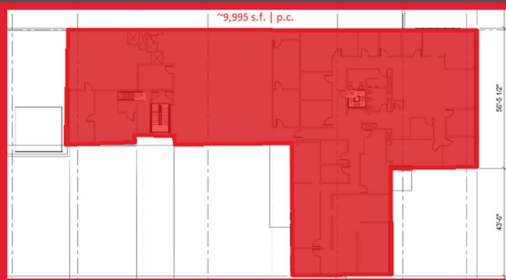
2ÈME ÉTAGE / 2ND FLOOR